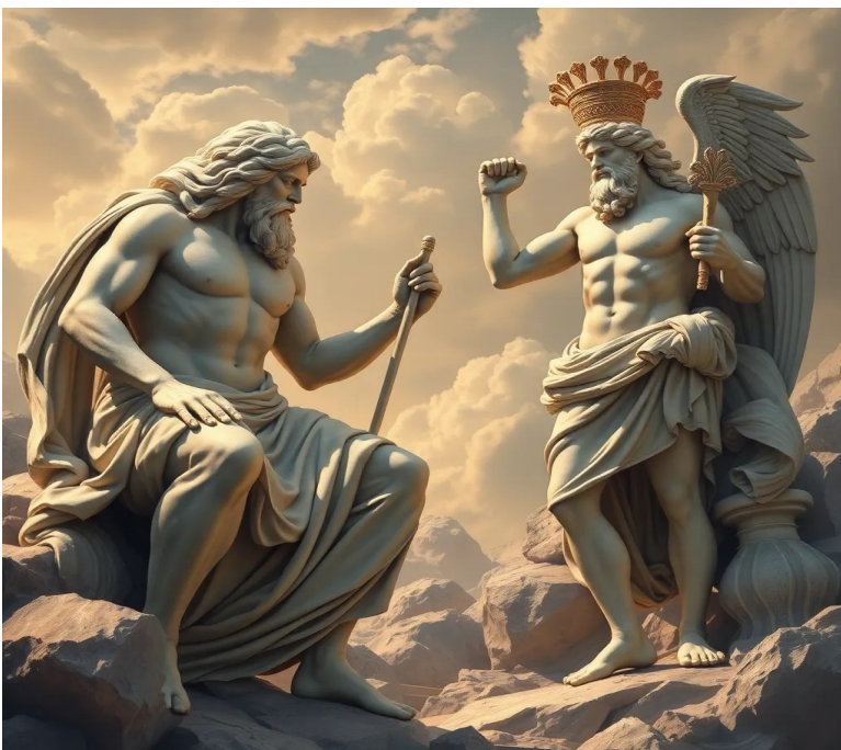
Zeus et Hermès

Lorsqu'il se couche, harassé, il se serre contre Lucile. Il hume le parfum musqué qui embaume le lit. Il se sent heureux. Frôlé par Morphée, son esprit déjà s'embrume aux portes des songes. Lucile ne dort pas; elle se love plus près. Elle dit dans un souffle et sa demande est sans conteste : « Chéri, raconte-moi une histoire. »